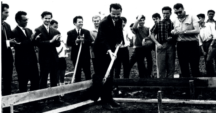
Ceremonia de punere a pietrei de temelie la Institutul de Petrol și Gaze, Ploiești, 1967