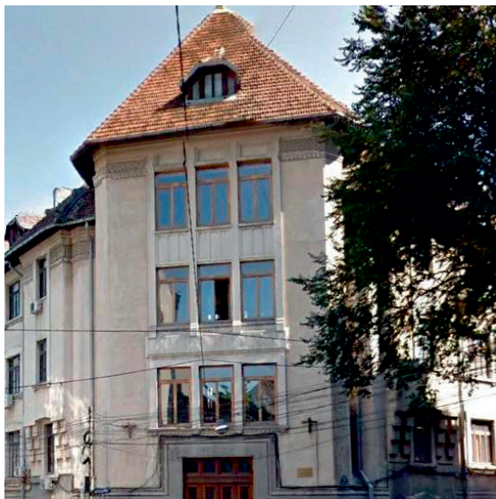
Institutul de Petrol, Gaze și Geologie, București, 1948

Ca o consecință firească a modificărilor structurale din anul 1957, Institutul de Petrol și Gaze și-a schimbat numele în Institutul de Petrol, Gaze Naturale și Geologie din București.