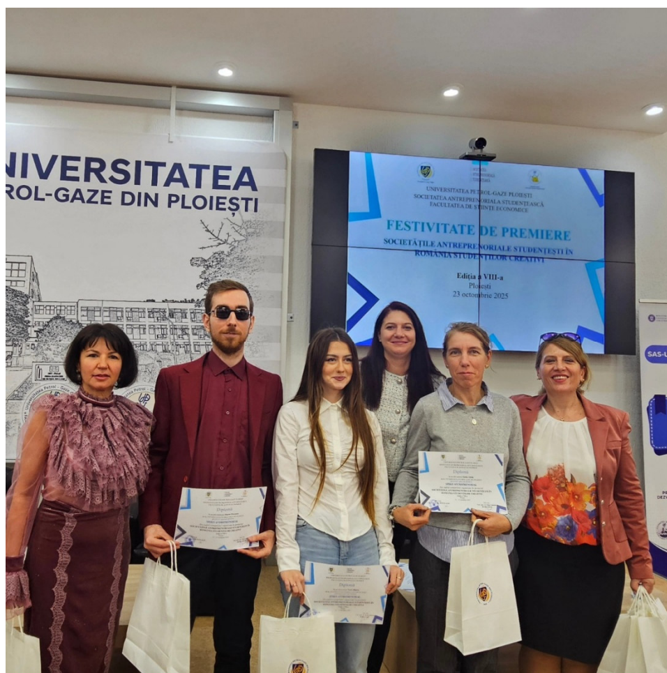
Comisia de evaluare a planurilor de afaceri și a ideilor de afaceri: